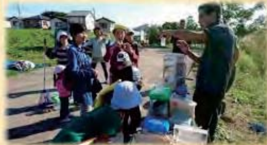
テナガエビの素揚げ おいしかったよ！