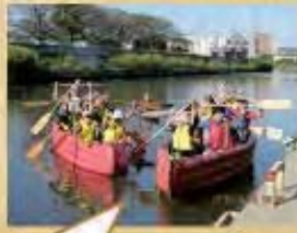
アユ目線で登って みよう！