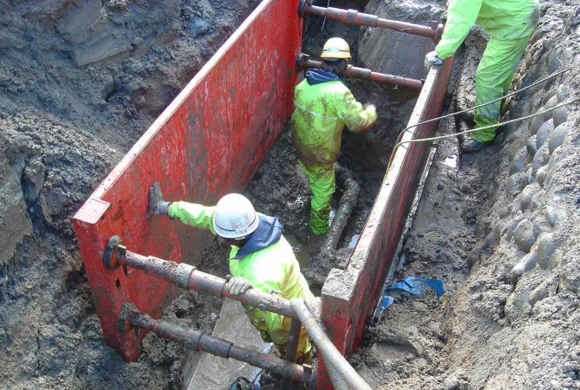
川口町 西川口地区応急本工事状況