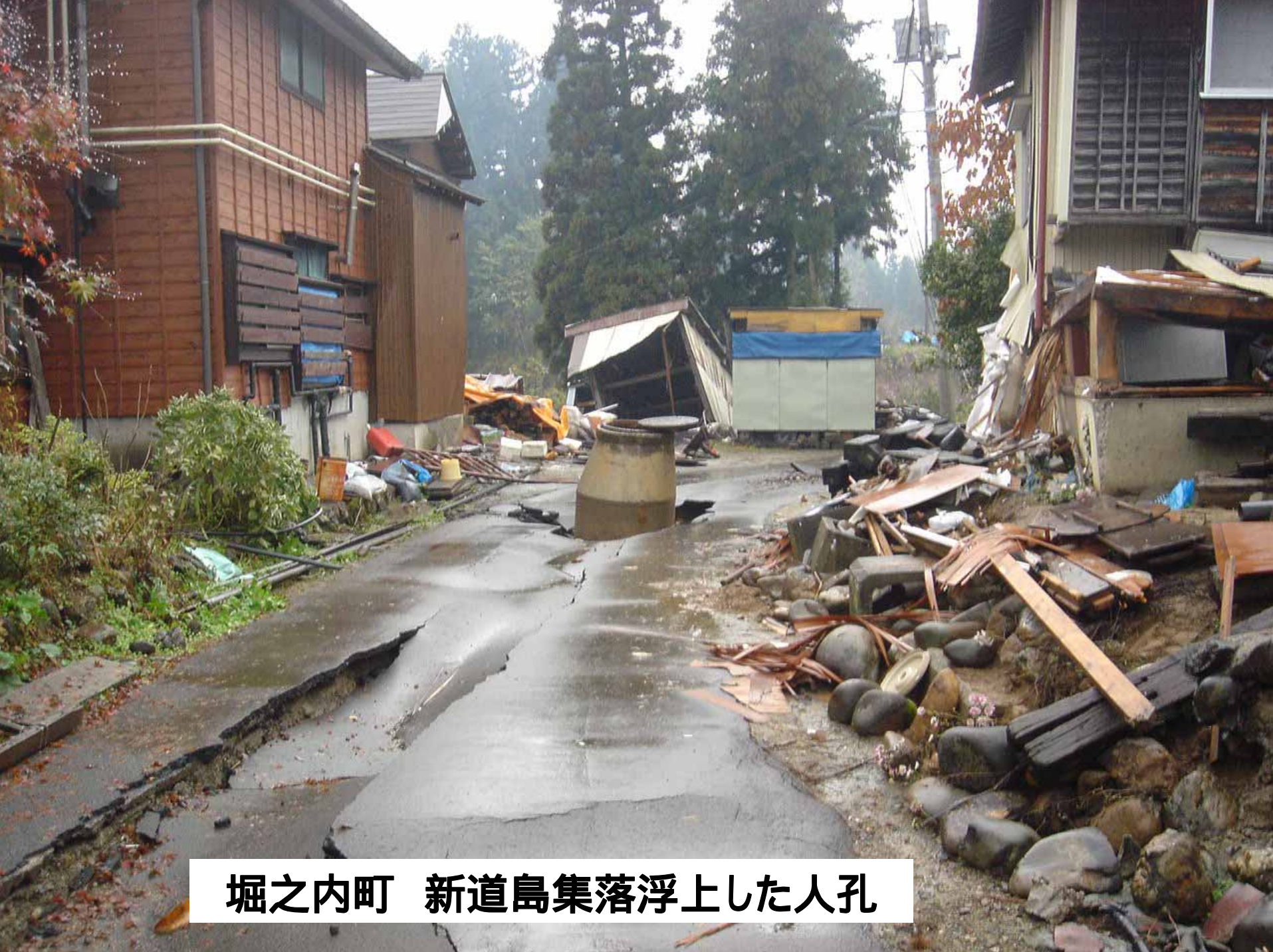
堀之内町 新道島集落浮上した人孔